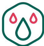
Gestion de la ressource en eau