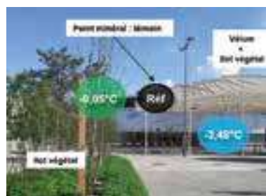
Mesure de l'effet rafraîchissant des végétaux